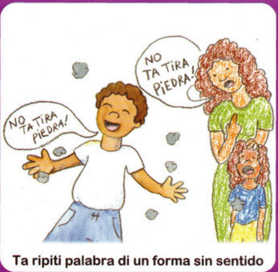
Ta ripiti palabra di un forma sin sentido